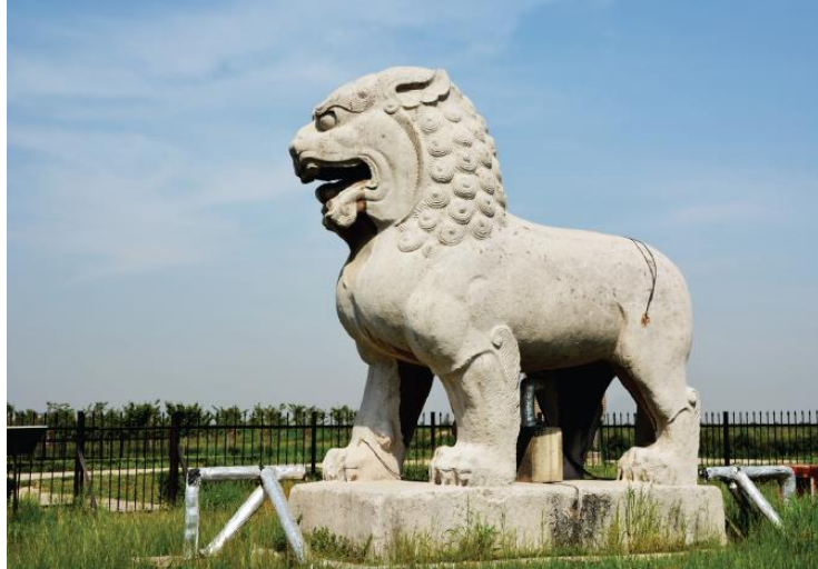
图7 唐顺陵南神门东侧走狮

七、先秦至西汉，陵园和墓向一般坐西朝东，从西汉末年开开始，经过十六国北朝、隋唐时则坐北朝南。这一变化的出现是受到当时丧葬习俗和都城形制的影响。