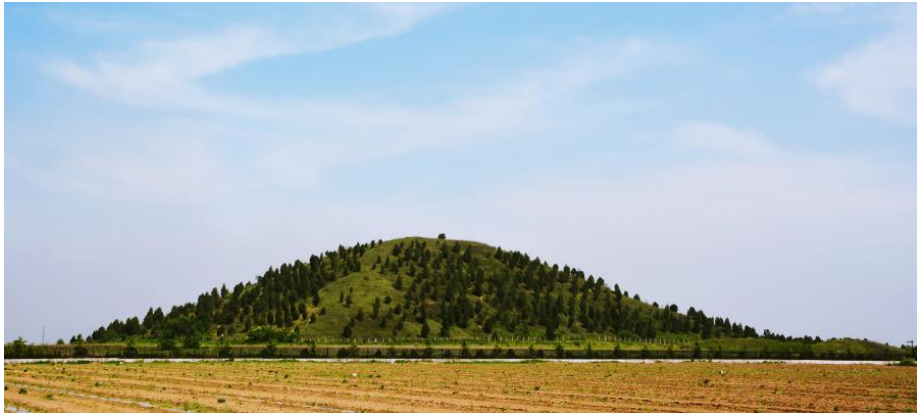
图3 汉武帝茂陵封土

在帝王陵园中都设置有众多的陪葬坑与陪葬墓。从秦始皇陵开始，陪葬坑中出现大型陶俑军阵，汉代帝陵得到继承与发展，出现了众多的军阵陪葬。西汉各帝陵都有很多陪葬墓，成为陵寝的重要组成部分。这些陪葬墓大多分布在帝陵以东司马门外神道两侧，少数在帝陵以北，形成很大的陪葬墓地。这种布局颇似诸侯和大臣朝谒天子的布置。据文献记载，长陵陪葬者有萧何、曹参、周勃、王陵等人，都是汉王朝的开国元勋、文武重臣，至今地面上还保留有 30 余个高大的坟丘。坟丘多为南北向排列并成分布，每一组内大多成对并列。陪葬墓附近还有园邑、祠堂之类建筑。陪葬于茂陵的有霍去病、卫青、金日磾、霍光、董仲舒、公孙弘等名臣，多为皇亲国戚和达官贵人。宣帝以后各陵的陪葬者则大部以外戚或者宦官为主。宣帝杜陵陪葬墓已发现 107 座，分为东南与东北两个区，每个区内又有成组的墓群，但见于文献记载的陪葬大臣只有大司马车骑将军张安世、丞相丙吉、卫尉金安上和中山哀王刘竟数人。其中，张安石的墓园已考古发掘，墓园规模庞大，有祠堂等建筑遗址。