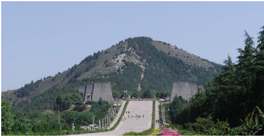
图6 唐高宗乾陵

帝陵建设既然是国家重点工程，必然是由朝廷重臣领衔挂帅，并由最优秀的建筑师、礼仪专家、艺术家和堪舆师团队负责选址和工程设计的。选址是最优先考虑、重中之重的项目，其过程非常复杂。选址的重点首先是考虑风水，即周边的自然环境，包括地理、地质、土壤、水文等方面的因素，但同时也须考虑陵址对国家、民族的长远影响，以及政治、军事、交通等多重因素。背山面水、地形高敞是帝王陵选择目的的必选因素。