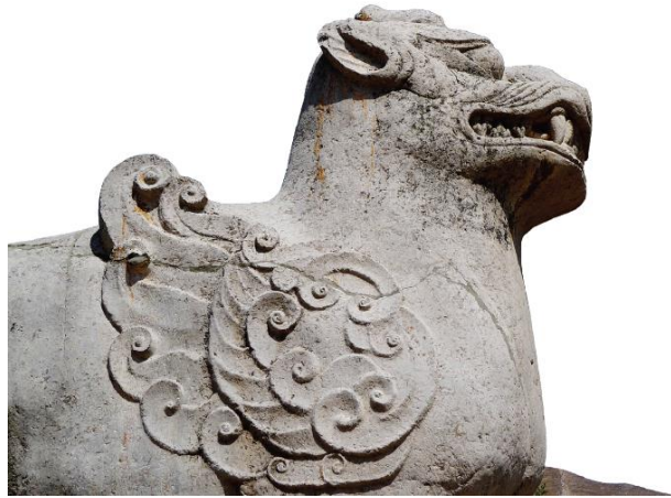
图4 唐睿宗桥陵神道西侧石兽

帝王陵的地宫部分，因现在发掘的极少，故不能详知具体情况。从已经发掘的秦公一号大墓看，其墓穴为一逐渐收分的敞开式竖穴大坑，规模十分惊人，东西两端有倾斜的墓道，墓葬形制呈“中”字形状，长达300米，深24米。棺槨和诸多陪葬品安放好以后，再加木结构棚架并填土，最后封平地面。棺槨为木制，有代表古代最高级葬式的“黄肠题凑”形制。从秦惠文王开始，秦王陵开始出现“亞”字形墓葬，即四个墓道，这在当时就是最高级别的墓葬，按照礼制是周天子才可以享用的，然而秦由于国力的强大和好大喜功，周天子仅成为名义上的共主，所以秦王陵开始使用这种形制。秦始皇陵地宫主体东西长170米、南北宽145米，开挖范围和墓室均呈长方形。在墓圪边沿建造有一圈巨大而且精细的夯土宫墙，高出地面竟达30米，顶部距封土表面最浅处只有1米左右。 ① 这一围绕墓室筑就的细夯土墙，在所有其他陵墓中从未发现过，无疑是秦始皇陵的一个创举。