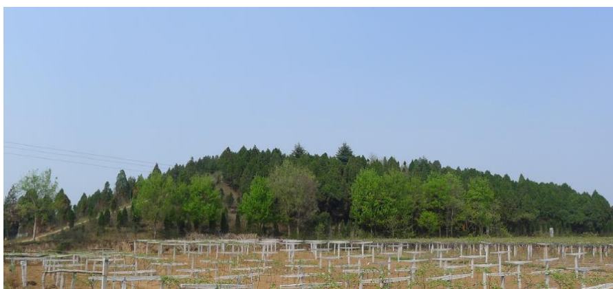
图 5 隋文帝泰陵封土

“天子即位，明年，将作大匠营陵地，用地七顷，方中用地一顷，深十三丈，堂坛高三丈，坟高十二丈。武帝坟高二十丈，明中高一丈七尺，四周二丈。内梓棺柏黄肠题凑，以次百官藏毕。其设四通羨门，容大车六马，皆藏之内方，外陟车石。外方立，先闭剑户，户设广龙、莫邪剑、伏弩，设伏火。已营陵，余地为西园后陵，余地为婕妤以下，次赐亲属功臣。”