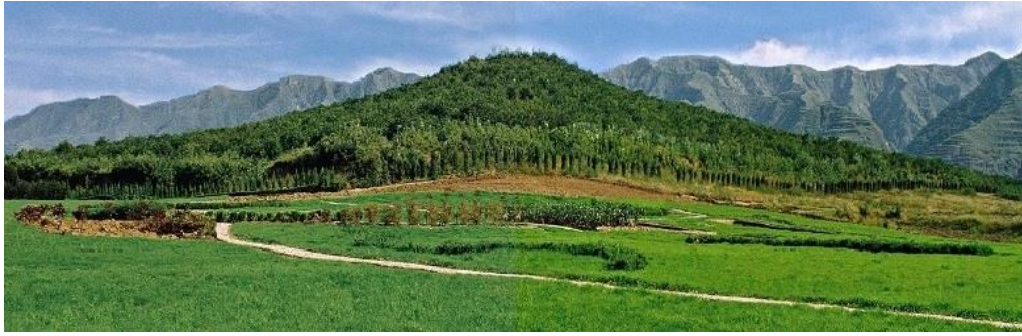
图2 秦始皇陵封土

《礼记·檀弓》上说：“土之高者曰坟，葬而无坟谓之墓。”古人自从迷信灵魂不死以后，凡事都要先向祖先祈祷，在庙堂祷告总不如直接到墓前祷告好，为了方便辨认出祖先墓穴的位置，于是他们就在墓穴的上面垒土或者种树作为标志。《礼记》上记载了一段孔子寻找父母之墓的故事。孔子三岁的时候父亲就死了，孔子成人后想去祭祀父亲时，却找不到墓地，后来经过许多老人的回忆，费尽工夫才找到了。孔子认为子孙祭祀祖宗是必要的礼节，为了方便经常前来祭祀、悼念祖先，他就在父亲的墓上培土垒坟作为标志。孔子说：“古也墓而不坟。今丘也，东西南北之人也，不可以弗识也。于是封之，崇四尺。”在墓穴的表面垒土种树，开始是为了辨识墓穴的位置，但后来就变成了显示墓主人身份地位的标志。《周礼》记载：“以爵为封丘之度，与其树数。”就是说，按照官位的等级来定封土的大小高度和种植树木的种类、数量。墓上开始出现封土，这是墓葬制度上的一大变化。从目前的资料来看，冢墓的出现在秦献公时期。《云梦秦简·法律答问》中记载：“何为甸人，守孝公献公冢者殴”。何为冢呢？扬雄《方言》云：“冢，秦晋之间谓之坟”。《周礼·序官·冢人》也云：“冢，封土为丘陵象冢而为之。”说明献公、孝公陵上已开始筑起封土了。随着墓葬封土的普及与发展，封土堆逐渐变得高大起来，形状好似山丘，因此墓葬的名称也发生了明显的变化。以前，各类墓葬统称为“墓”，到了战国时出现了“陵”“冢”“坟”“丘”等多种名称。秦的陵墓就经过了“墓”“陵”“山”的演变过程，秦始皇陵原名称为“丽山”，以显示其高大雄伟。后来就有了以山为陵的冢墓，到唐代发展到极致。